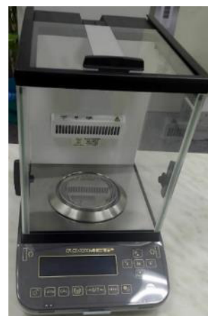
Общий вид модификаций ВЛА-220С-ОА, ВЛА-320С-ОА (исполнение с автоматизированной витриной)